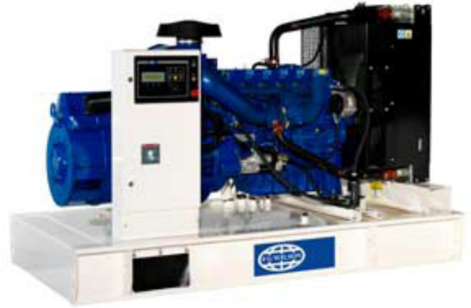
Imagen con finalidad ilustrativa únicamente